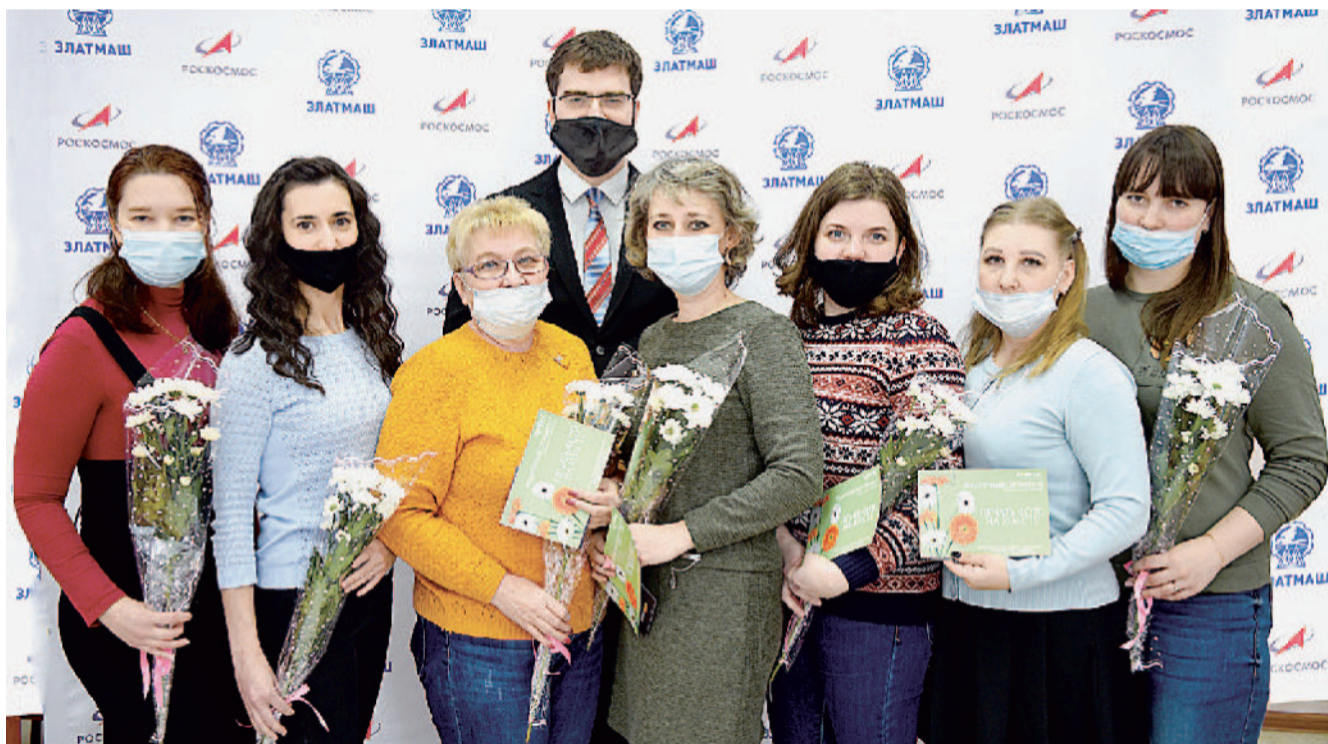
Автор кроссворда с победительницами интеллектуального конкурса.

Участвовать могут все работники АО «Златмаш» без ограничений по возрасту и стажу.