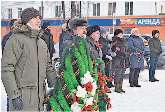
Венки и цветы — к обелиску Славы.

Традиционный митинг в преддверии празднования Дня защитника Отечества прошел у обелиска Славы, возведенный в честь участников и ветеранов Великой Отечественной войны, работавших на Златоустовском машиностроительном заводе.