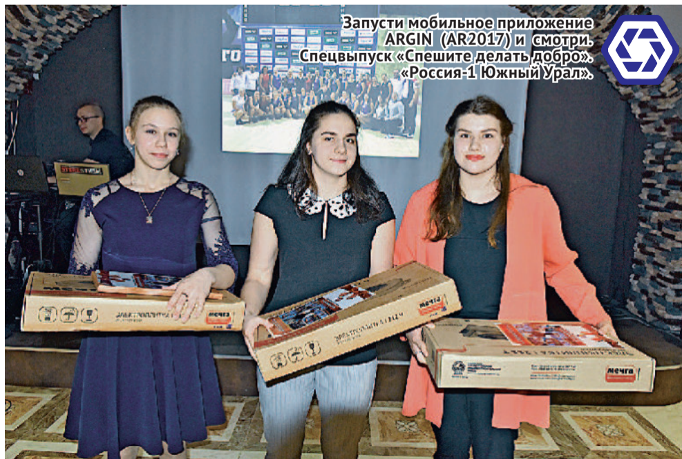
«Мечту» — в подарок лучшим ватерполисткам.