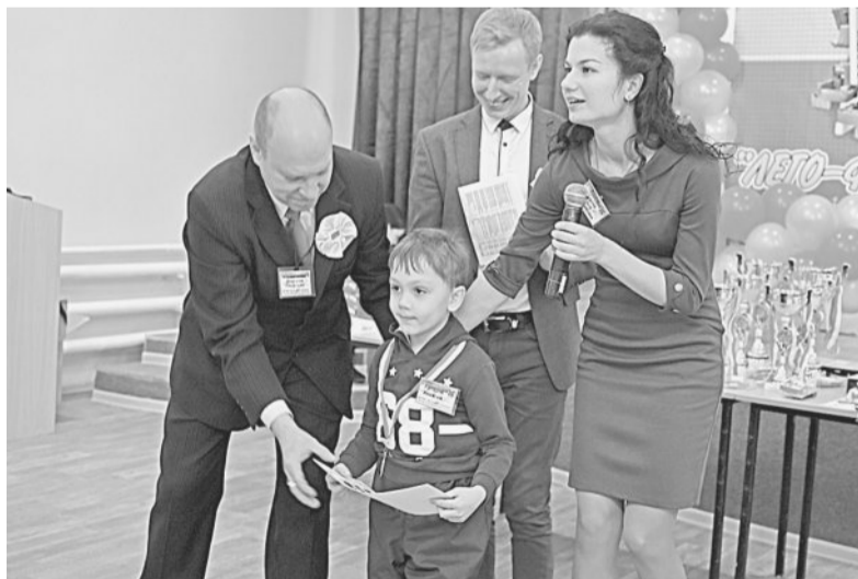
ТЫ — ЛУЧШИЙ! Церемония награждения победителей фестиваля «Лего-фантазии».

Высокий уровень подготовки к фестивалю продемонстрировали дошкольники и учащиеся начальной школы, представившие свои проекты на выставках «Роботы мечты» и «Роботы будущего», а также ребята, выступившие в соревновательном направлении «Чертёжник».