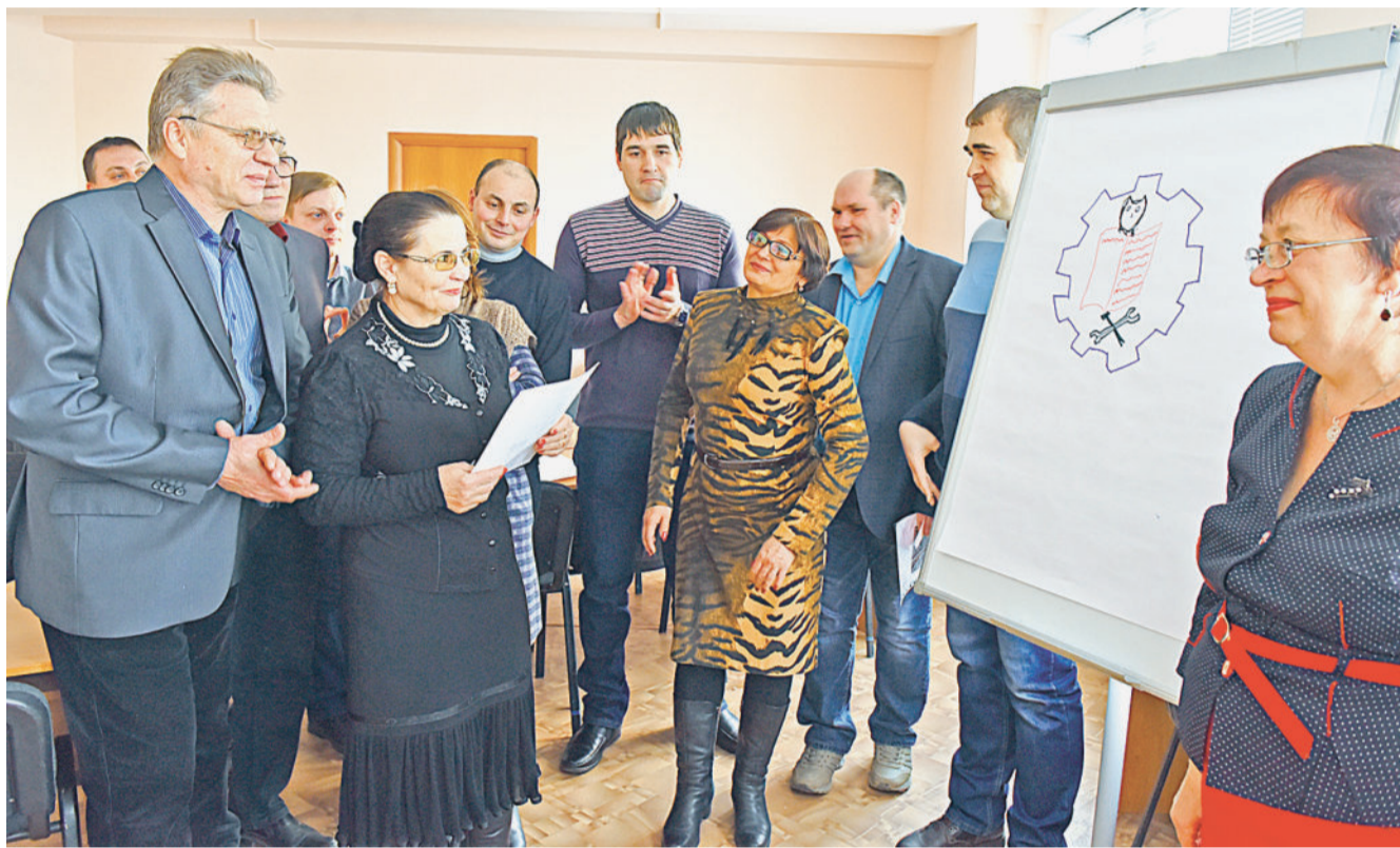
Разминка для ума.

На финишной прямой участникам предстояло защитить свои проекты по усовершенствованию системы наставничества, повышению эффективности профессиональной и социальной адаптации новых сотрудников. К своим выступлениям заблаговременно подготовились представители цеха по изготовлению серийной продукции № 2, автотранспортного цеха № 7, ТЭЦ